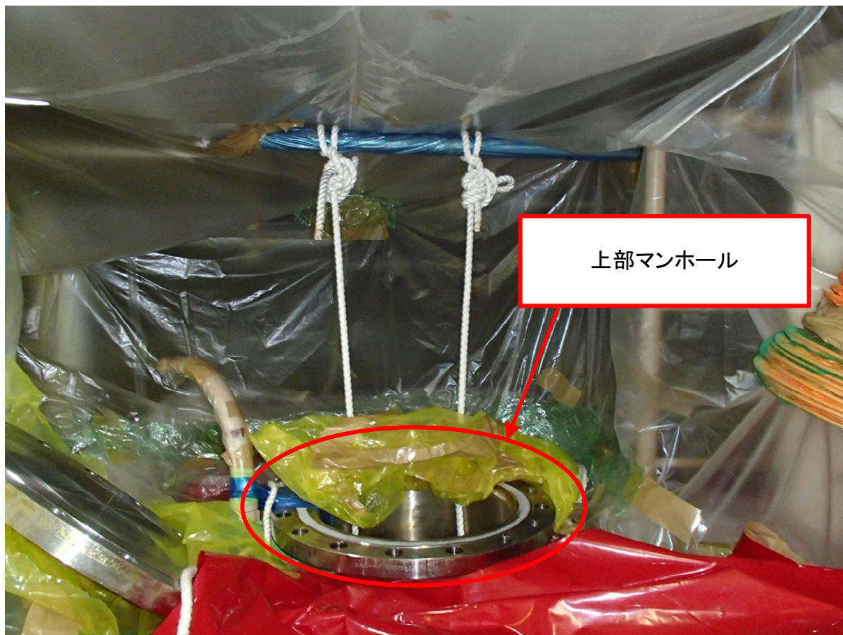
ほう酸タンク3B タンク上部の状況