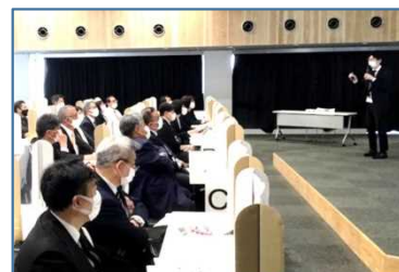
NO.1 2021年4月 地域授業改善協議会

今日は、しっかり学び、しっかり笑顔にふれたい。事務所の指針である、理念や規範を実践を通じ実感できました。今後は、教頭として、今日学んだことを学校の先生方に広げたいです。子どもの笑顔があふれるように、先生方を笑顔にしていきたいです。(4点セットは見直ししたいと思います。) トランプカードが