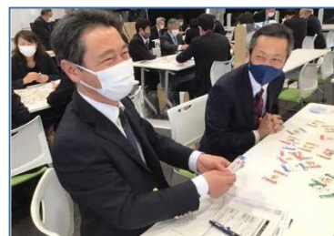
NO.4 2021年4月 地域授業改善協議会