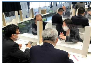
NO.3 2021年4月 地域授業改善協議会