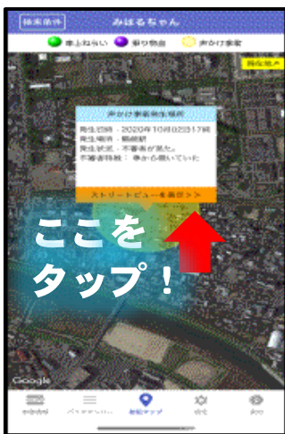
ストリートビュー画面