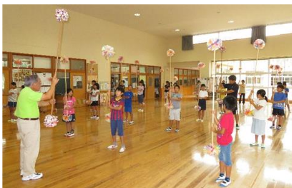
【神杖踊りの練習をする小学生】

平成 30 年度に国民文化祭の大分大会が開催されることとなり、これを契機に本匠校区