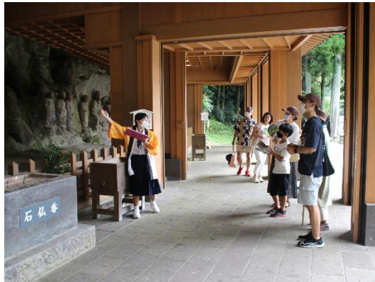
【臼杵石仏を案内する認定ガイド】

組として各学校での受験が可能な「臼杵っこ検定」を実施している。検定の中・上級合格者の中から希望者を募り、年4回の講習会を経て、ガイド及び学芸員を認定し、認定者には認定書の交付を行っている。