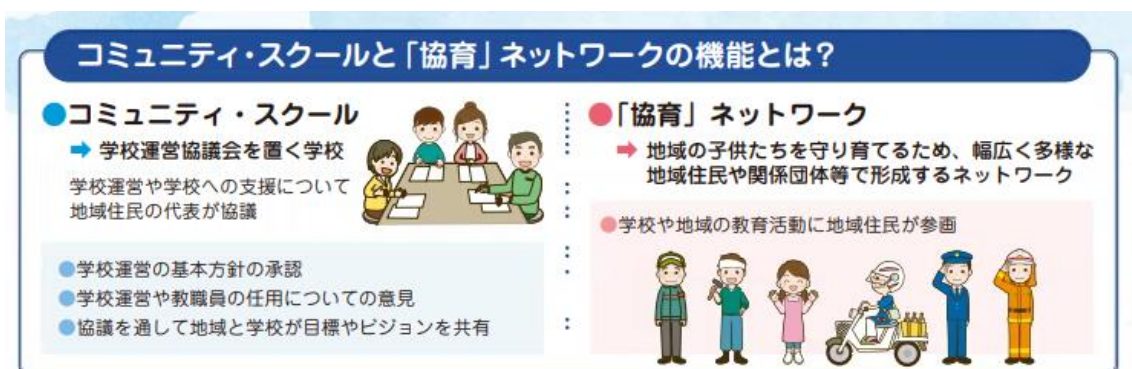
コミュニティ・スクールと「協育」ネットワークの仕組み

これにより、従前から市町村の社会教育行政が進めてきた学校関係者・保護者・地域住民・社会教育関係団体等が子どもたちの育ちや学びを地域ぐるみで見守り、支援する「協育」ネットワークと学校との組織的連携が一層求められるようになりました。