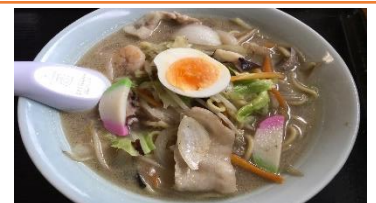
桜王と野菜たっぷりちゃんぽん