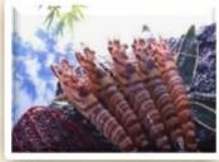
보리새우 가을, 겨울에는 양식 · 활어, 봄, 여름에는 냉동으로. 365일 즐길 수 있다