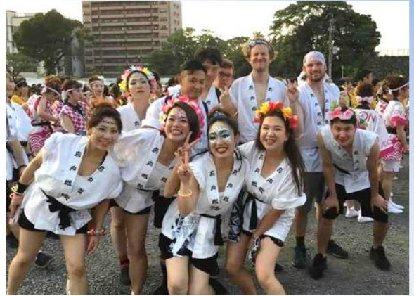
오이타에서 여름에 열린 후나이팍칭에서 동료들과 함께

이번 코너에서는 과거에 국제교류원 등으로 오이타의 국제화에 몸담았던 분들이 지금은 어디에서 무엇을 하고 있는지를 소개합니다.