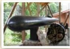
가이텐 신사 태평양 전쟁의 비참함을 알리며, 매년 전사자를 위한 위령제가 열린다 모습은 히지하면 떠오르는 여름 풍경