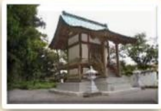
히메코소사 고사기 · 일본서기에도 등장하는 역사가 긴 신사