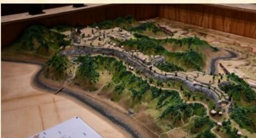
애플리케이션으로 오카 성 디오라마를 보면...

추천합니다. 그 외에도 만화 『분고 오카 성 이야기(豊後岡城物語)』를 바탕으로 한 영상 작품을 감상할 수 있는 이시가키 시어터, 오카 성과 성하 마을의 벽면 지도, 방문객이 직접 추천 정보 등을 적을 수 있는 정보 코너 등도 있습니다.