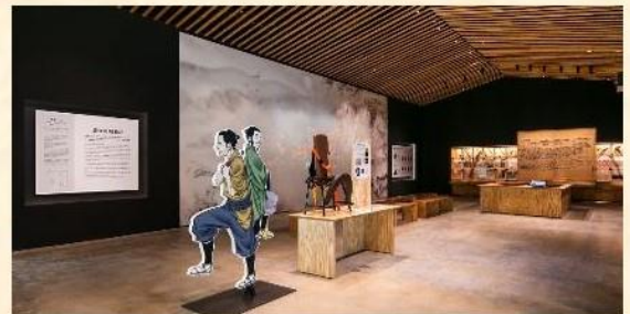
가이드스 센터에서 공부 한 뒤 오카 성에 방문하는 것을

800분의 1 사이즈의 오카 성 디오라마에서는 층암 절벽에 우뚝 솟은 오카 성의 모습을 볼 수 있으며, 스마트폰 애플리케이션 『오카 성 시공 산책(岡城時空散歩)』을 비추면 돌담 위에 건물이 나타납니다.