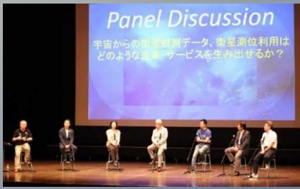
패널 디스커션을 진행하는 모습

8월 8일(토), 9일(일)에 2021년 6월 개최 예정인 제33회 우주 기술 및 과학 국제 심포지엄(ISTS) 오이타 벵푸 대학의 킷오프 이벤트가 열렸습니다.