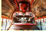
(오이타시) 유스하라 하치만구

그리운 우리 고향 ~오이타 후루사토 사진관~ 【 오이타 시 / 벳푸 시 】