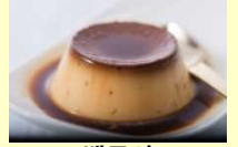
(벳푸시) 지옥찜 푸딩