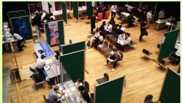
벳푸 행사장 설명회 모습

앞으로도 가능한 선에서 기업과 유학생을 연결해 주는 기회 및 유학생이 오이타 현 기업을 알아갈 기회를 늘려 현내에서 취직하고 싶다는 유학생의 꿈을 한 명이라도 더 이루어 줄 수 있도록 합동 기업 설명회 및 온라인 기업 설명회, 기업 견학회, 개별 상담 등을 실시하여 유학생의 현내 취직 촉진을 추진하도록 하겠습니다.