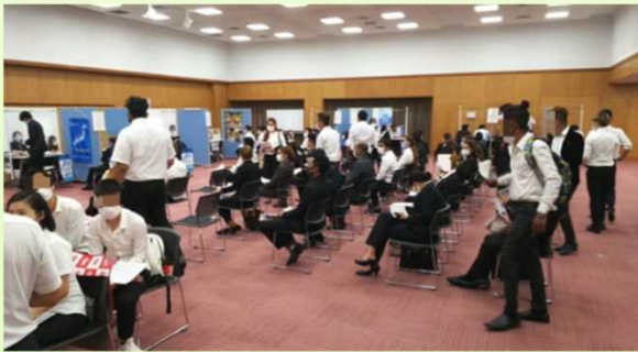
오이타 행사장 설명회 모습

현 내 취 직 ▶ 합동 기업 설명회 ▶ 온라인 기업 설명회 ▶ 기업 견학 ▶ 개별 상담