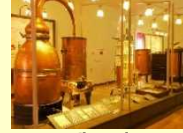
(벳푸시) 향기의 숲 박물관