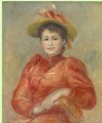
피에르 오귀스트 르누아르 <빨간 드레스를 입은 젊은 여인> (1892년 경)