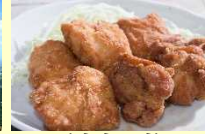
(나카쓰시) 나카쓰 가라아게