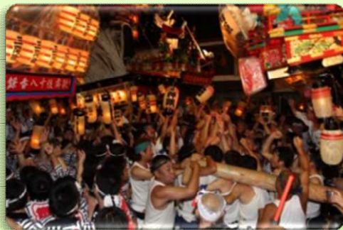
히타 기온 마츠리