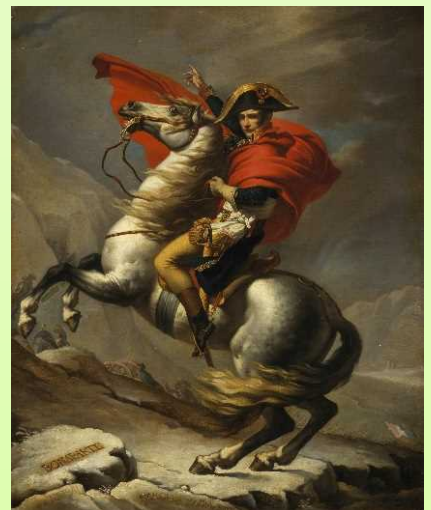
자크 루이 다비드 <생 베르나르 고개를 넘는 나폴레옹> (1805년)