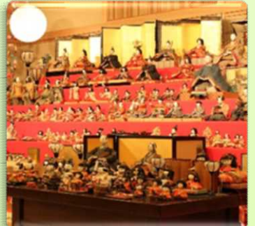
덴료 히타 오히나 마츠리

에도 시대에는 막부의 직할지 ‘덴료(天領)’로써 규슈의 정치 경제의 중심적 역할을 담당하였고, 독자적인 상인 문화가 발달하여 오래된 거리가 남아있는 마메다마치(豆田町)에서는 지금까지도 당시의 영광을 느낄 수 있습니다. 또한 히타 시에서는 5월에는 초여름이 찾아왔음을 알리는 ‘히타 가와비라키 관광제’, 7월에는 약 300년의 역사를 지닌 ‘히타 기온제’, 11월에는 에도 시대의 영광을 재현하는 ‘히타 덴료 마츠리’, 마지막으로 2월부터는 봄을 알리는 ‘덴료 히타 오히나 마츠리’ 등 4대 축제를 포함하여 1년 내내 다양한 축제가 열립니다.