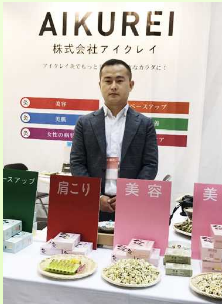
다양한 제품을 개발하고 있습니다

오이타 현에서는 2016년도부터 ‘오이타 유학생 비즈니스 센터’를 설치하여 유학생의 현내 창업 및 현내 취직 촉진을 도모하고 있습니다. 현재, 동 센터에서는 전 유학생이 설립한 회사 등 9개사가 입주해 있으며, 이번에는 뜬을 제조·판매하고 있는 (주) AIKUREI를 소개합니다.