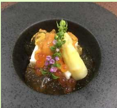
이런 음식을 만들고 있습니다