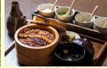
(히타시) 히타 장어