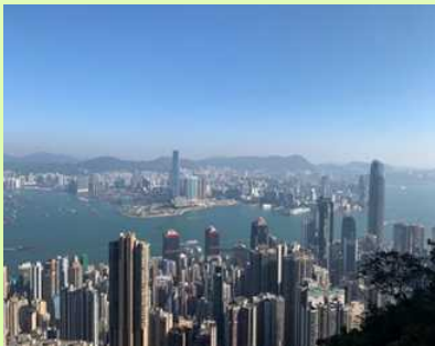
홍콩 고층 빌딩가

홍콩에 와서 먼저 홍콩 분들의 파워에 놀랐습니다. 요즘은 코로나 등의 영향으로 외출하는 사람이 줄어들었지만, 평소에는 인구 밀도가 높고 사람들이 정신없이 움직이곤 합니다. 차찬탕(茶餐廳:홍콩식 카페 레스토랑)은 항상 사람이 많고, 곳곳에 있는 가이시(街市:지방 시장)도 항상 북적거립니다.