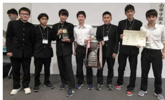
1位の大分上野丘高等学校 Aチーム