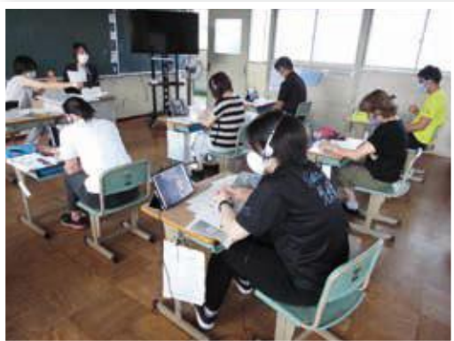
大分県教育センターの出前研修 宇佐市立院内中部小学校の様子(R2.8.26)

今後、学校の教室で行う通常の授業が困難な状況にあっても、児童・生徒の学びを保障するためには、 教員が日常的にオンラインで授業を行える体制 を整備する必要があります。