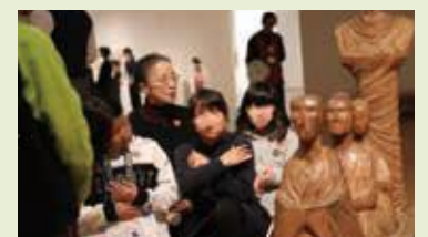
3階コレクション展示室での様子