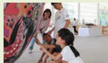
1階アトリウムでの様子

令和元年度 参加校数/23校 参加児童数/546人 令和2年度 参加校数/19校 参加児童数/532人(予定)