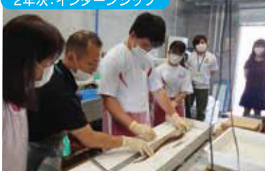
北部水産研究指導センター