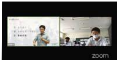
オンラインでも行いました!