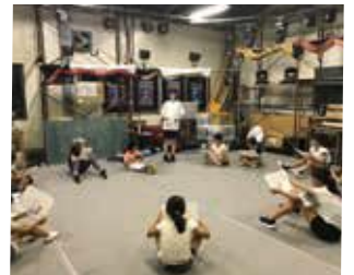
しげまさ子ども食堂での演劇指導(昨年の様子)

私の子どもが演劇部に入部し、「変わった」と思ったことが交流の始まりでした。小中学生たちは、地域の高校である三重総合の生徒たちと一緒に活動できる場が増え、とても喜んでます。「三重総合高校に入学する!」という未来を思い描いているかもしれません。