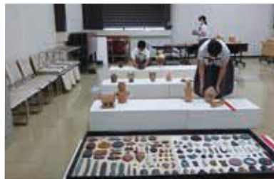
大分県立歴史博物館