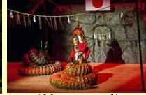
(분고오노시) 카구라 회관