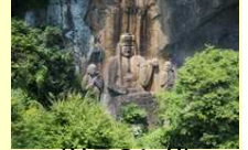
(분고오노시) 후코지 마애불