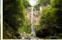
(우사시) 히가시시이야 폭포