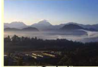
(우사시) 아지무의 안개 낀 아침