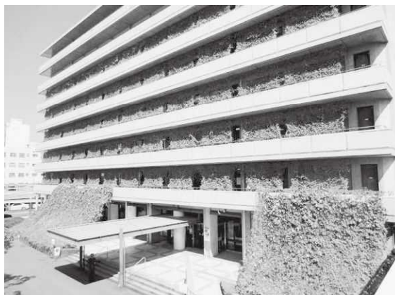
春「エコ花ライフ」～緑のカーテン（大分市）

春にはアサガオやヘチマ等のツル性植物で窓際や壁面に「緑のカーテン」を育てる『エコ「花」ライフ』、夏には風呂の残り湯などの二次利用水を使って「打ち水」を行う『エコ「涼」ライフ』、秋には食材の使い切りや省エネ調理法などの「エコ・クッキング」に取り組む『エコ「食」ライフ』、冬には重ね着等により暖房の設定温度を抑制する『エコ「暖」ライフ』の実践を呼びかけている。