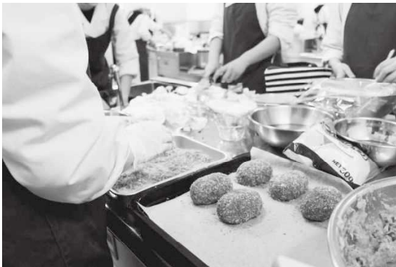
秋「エコ食ライフ」～エコ・クッキング