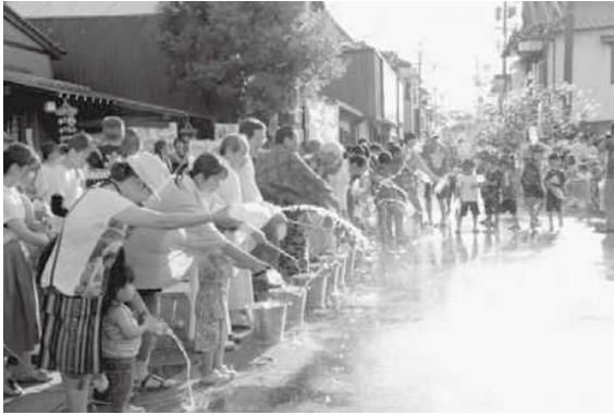
夏「エコ涼ライフ」～打ち水（臼杵市）