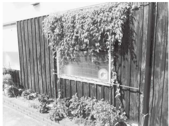
緑のカーテン応募写真 (ホップ美容室)