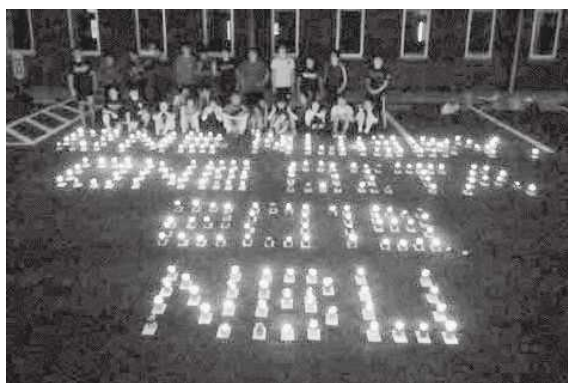
日本文理大学附属高等学校（佐伯市）

佐伯市では、おおいたうつくし推進隊である日本文理大学附属高等学校が学生が主体となってキャンドルナイトを灯し、日田市では咸宜園教育研究グループが不要な照明のライトオフ・ライトダウンに取り組むなど、県下各地で特色ある取組が展開された。