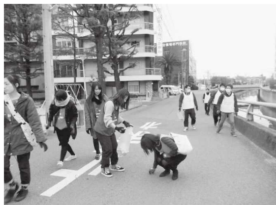
県民一斉おおいたうつくし大行動