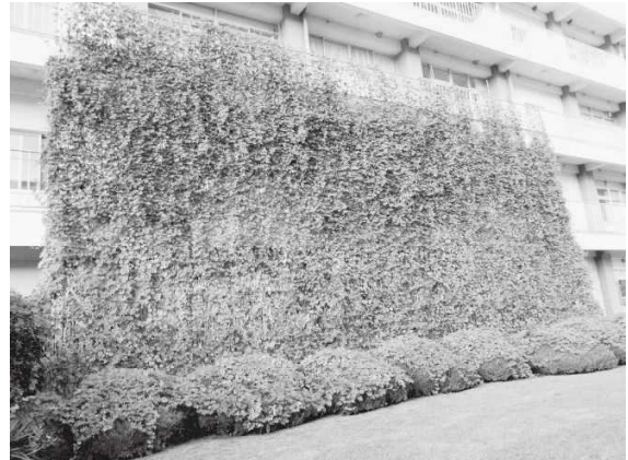
緑のカーテン応募写真 (大分県立玖珠美山高等学校 チーム野菜2年)

また、「緑のカーテンフォトコンテスト」を実施し、平成30年度は家庭、学校、事業所から、60点の応募があり、最優秀賞1点、部門賞5点、特別賞10点を選出した。