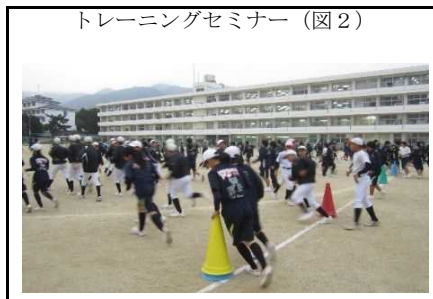
トレーニングセミナー(図2)