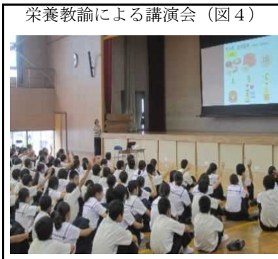
栄養教諭による講演会(図4)