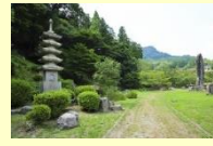
(九重町) 旧久留岛氏庭园