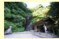
(玖珠町) 中塚不动尊