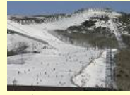
(九重町) 九重森林公园滑雪场