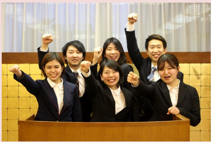
本年度派遣的留学生们