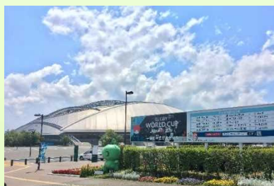
举办赛事的大分体育公园综合竞技场