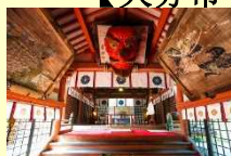
(大分市) 柞原八幡宫