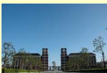
(别府市) 立命馆亚洲太平洋大学