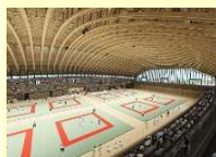
(大分市) 县立武道体育中心