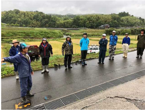
作業前のあいさつ