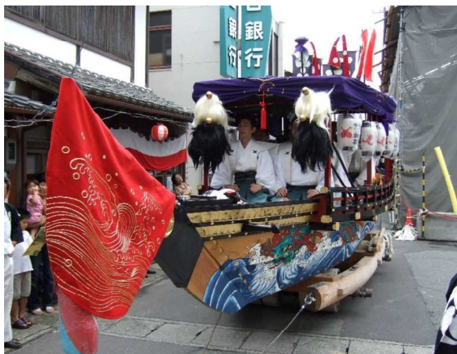
お船の巡行：8月3日の午後から深夜まで巡行する。

現在では、浜崎町内で引き受け、演唱者も選定し、「お船謡」を今日まで伝承しています。