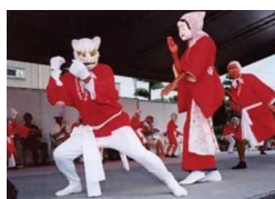
日向ひよっこ夏祭