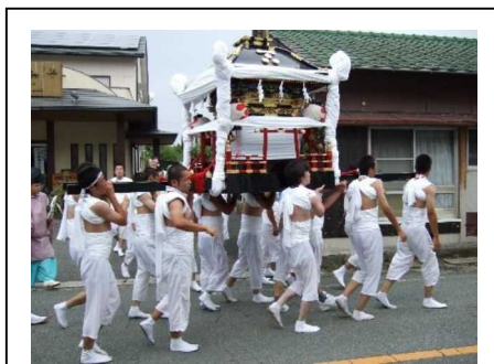
神輿の巡行：8月2・3日に巡行する。