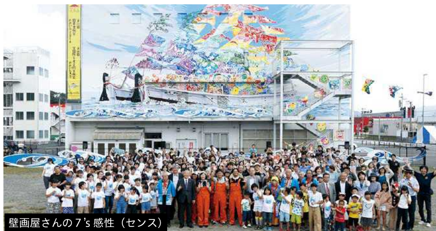
壁画屋さんの7's感性 (センス)