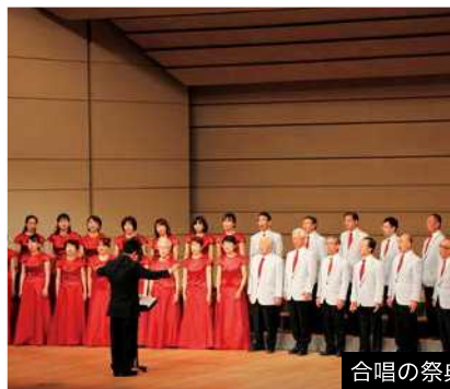
合唱の祭典 in 津久見