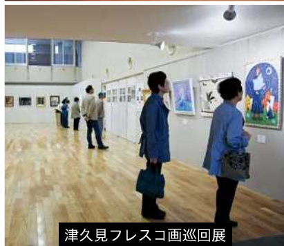
津久見フレスコ画巡回展