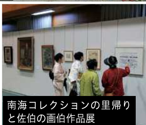
南海コレクションの里帰りと佐伯の画伯作品展