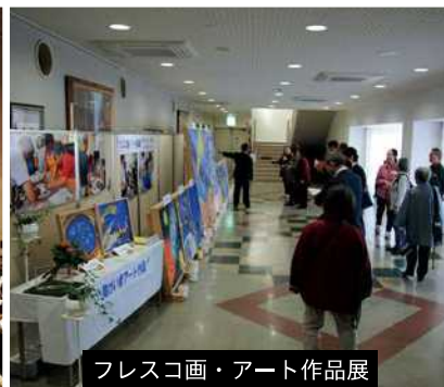
フレスコ画・アート作品展