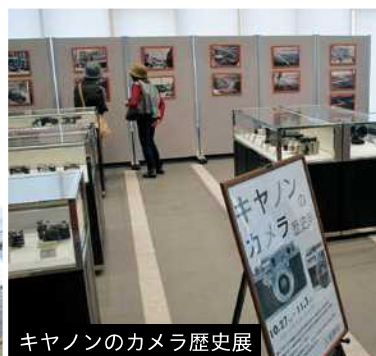
キヤノンのカメラ歴史展