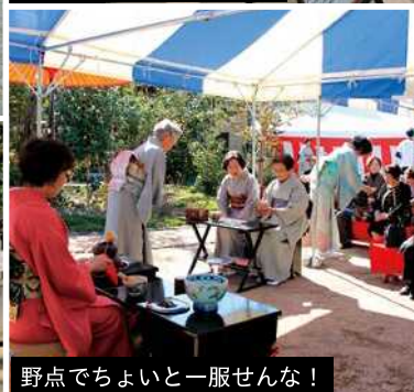
野点でちよいと一服せんな!