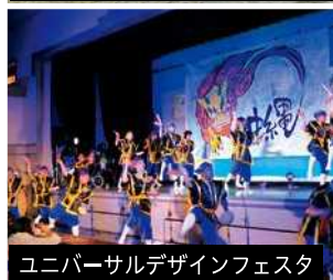
ユニバーサルデザインフェスタ