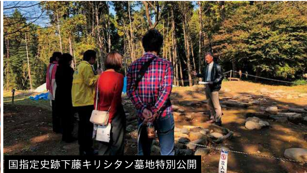
国指定史跡下藤キリシタン墓地特別公開