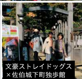
文豪ストレイドッグス×佐伯城下町独歩館