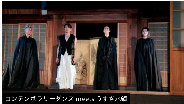
コンテンポラリーダンス meets うすき水鏡