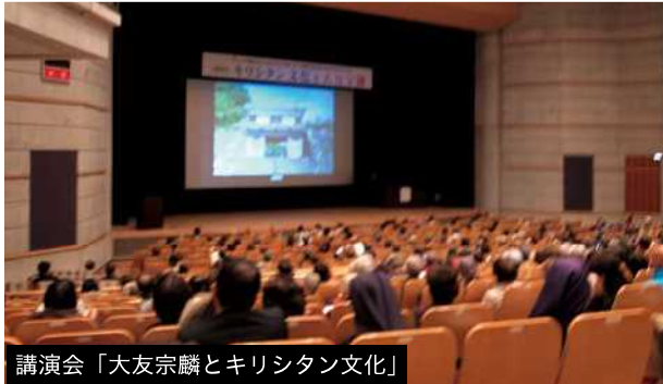
講演会「大友宗麟とキリシタン文化」