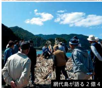
網代島が語る 2億4千万年前の宇宙と地球