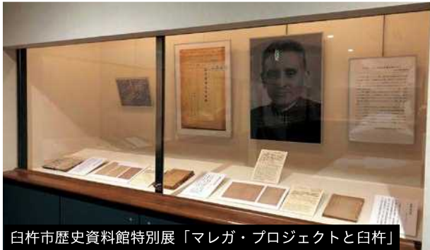
白杵市歴史資料館特別展「マレガ・プロジェクトと白杵」