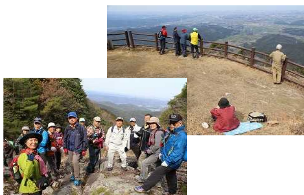
登山イベントの様子