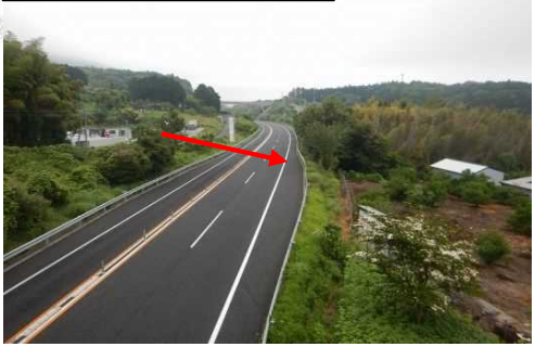
②公共施設(日出バイパス)