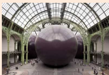
利维坦, 2011 PVC / 33.6 x 99.89 x 72.23 m monumenta, 2011, 巴黎大皇宫, 巴黎

卡普尔先生1991年获得了世界为数不多的现代美术大奖特纳奖，2011年获得了日本高松宫殿下纪念世界文化奖，在全世界享有较高声望。在日本举办大型展览会尚属首次，因此广受瞩目。