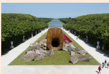
航脏的角落, 2011-2015 混合技法 尺寸可变 凡尔赛宫 2015