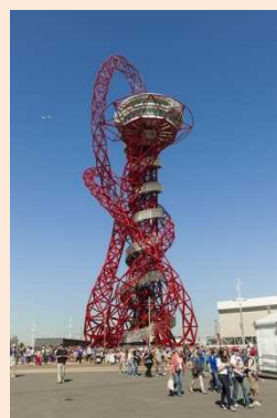
轨道, 2012 不锈钢 高度: 115 m 伦敦英女王奥林匹克公园

另外，「第33届国民文化节 大分 2018」「第18届全国残疾人艺术文化节 大分大会」同期召开。（详情见网页 http://www.oita-kokubunsai.jp/ ），除了本展之外，县内各地将会举办160场左右的多彩艺术文化盛宴。