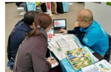
[就農相談会でのタブレットを用いた説明の様子]

庁外での打合せや説明会において、写真や動画等、庁内にある必要なデータを活用できるようになり、迅速で、わかりやすい説明が可能となりました。