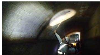
[ネットワークを活用した隧道点検]