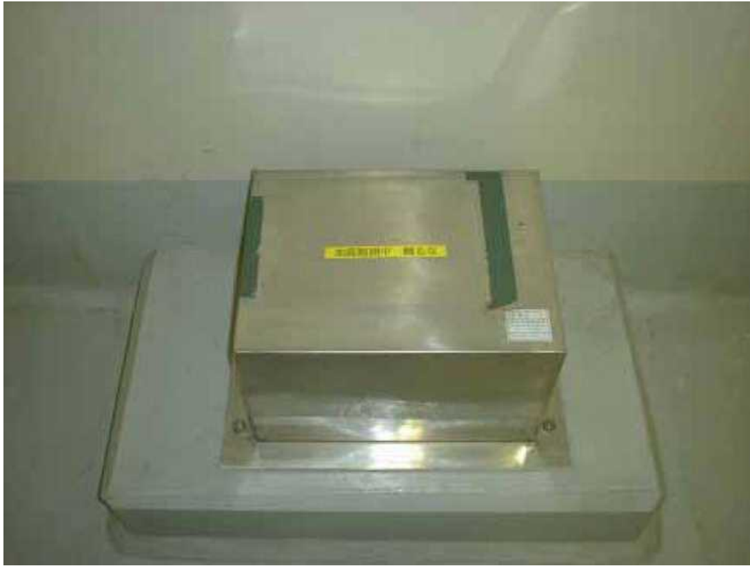
観測用地震計（検出部）