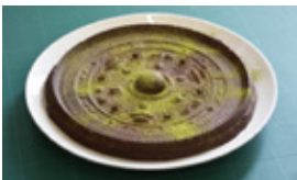
三角緑神獣鏡チョコ