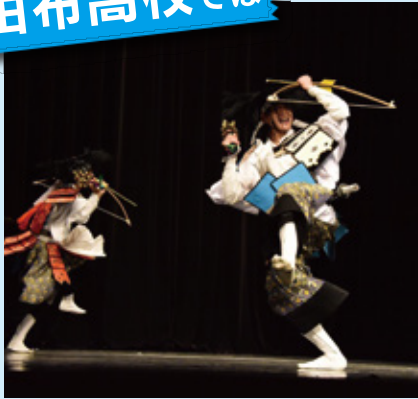
台湾での郷土芸能部神楽公演