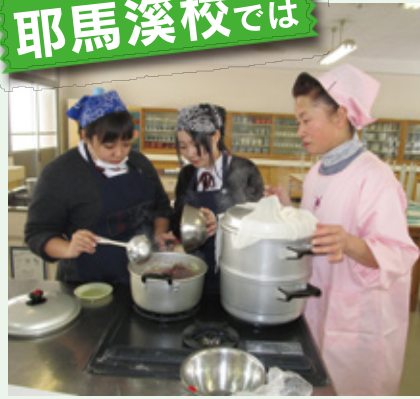
達人による郷土料理教室