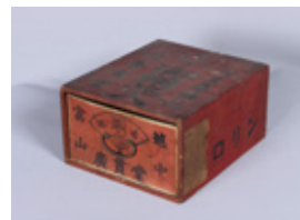
越中富山薬箱(大分県立歴史博物館所蔵)