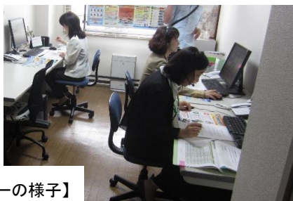
【コールセンターの様子】