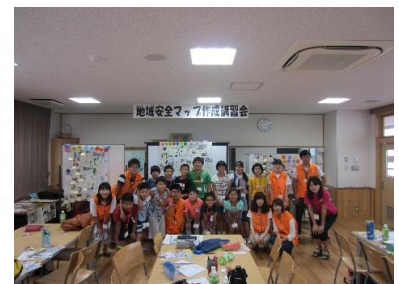
【地域安全マップづくり】

大学や専門学校等に通っているお子さんをお持ちの方は、是非、参加を勧めてください。