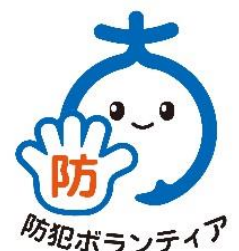
【防犯ボランティアシンボルマーク】