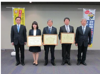
【活動優秀企業・団体表彰】

今回のセミナーでは、防犯活動等に継続的、自主的、積極的に取り組んでおられる「一般社団法人大分県LPガス協会様」「大分県農業共済組合様」「ジェイリース株式会社様」に感謝状を贈呈しました。