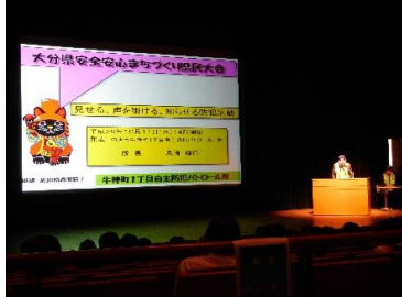
【パトロール隊活動事例発表】