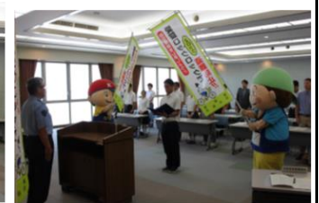
【自転車盗難防止GRAND PRIX 2017 開会式】