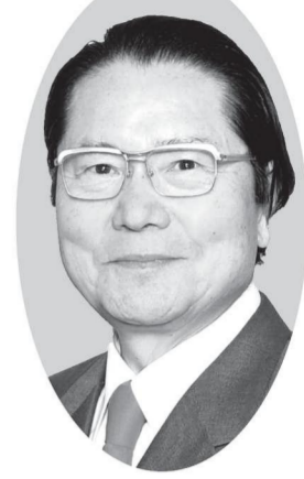
自由民主党公認 (大分2区) 衛 藤 せいしろう えとう 征士郎

社会保障・外交防衛・経済 積み上げてきた実績を、確かな政治に活かします。 ◎超高齢化社会に向き合う。 年金・医療・介護を守る持続可能な社会保障制度のために、財源の確保が第一。経済を活性化させると共に、消費税10%は避けられない(世界水準は20%)。 ◎0歳からの乳幼児教育の無償化など、子育て支援 低所得層の高等教育に給付型奨学金の拡充 ◎自然災害の脅威に對して。 治山・治水・治道を中心に、防災・減災の国づくりを進める。災害時多目的緊急支援船(病院船)の実現(推進議連会長)。 豪雨災害、地割れ、震災からの復旧、大分県下は甚大な被害を受け、多くの被災者が窮地に立っています。激甚災害指定、災害救助法、普通交付税の繰り上げ交付、被災者の生活再建など、国の厚い支援が必要です。与党の大分代表として、総力をあげてふるさと大分を守ります。