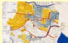
上高家村地引絵図