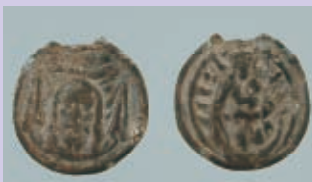
ヴェロニカと聖母子像のメダイ