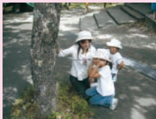
樹木の鼓動(?)が聞こえる

お問合せ 県立九重青少年の家 玖珠郡九重町大字野田204-47 TEL 0973-79-3114 http://www.oitall.jp/kokonoe/