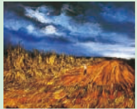
「雷雨の日の収穫」1950年 ©ADAGP, Paris & SPDA, Tokyo, 2008