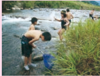
水辺には何がいるのかな