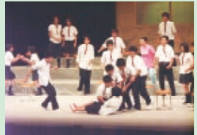
昨年度の舞台から