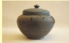
宇佐市山本出土蔵骨器