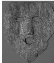
邪馬台国の首都と推定されてい る奈良県纏向遺跡出土の仮面