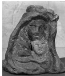
大分市丹生出土の聖母子像聖イ エス会 栄光の賛美教会所蔵