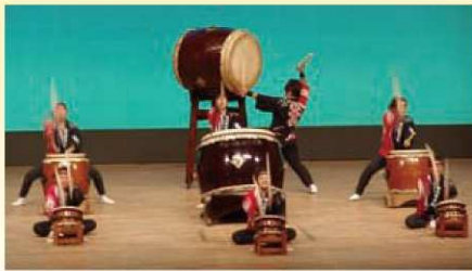
昨年度公演風景(日本音楽部)

次代を担う若者たちによる和楽器演奏の粋! 吹奏楽の熱く、華やかな競演! 芸術会館文化ホールの本格的なステージで彼らの情熱をぶつけた舞台を、 どうぞご堪能ください。