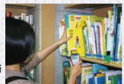
こうやって1冊づつ点検します