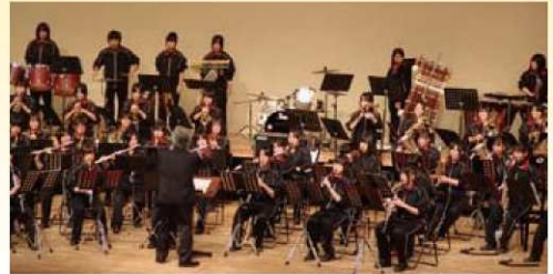
昨年度公演風景(吹奏楽部)