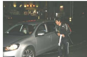
中津駅北口ロータリーにて