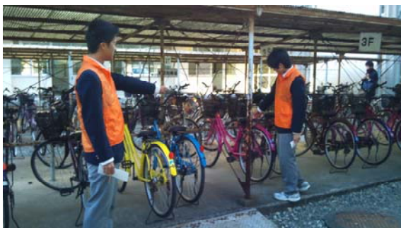
1. 整備状況のチェック