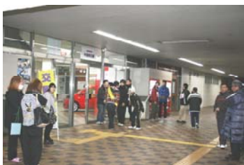
中津駅南口配布準備