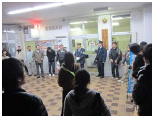
中津駅交番前に集合