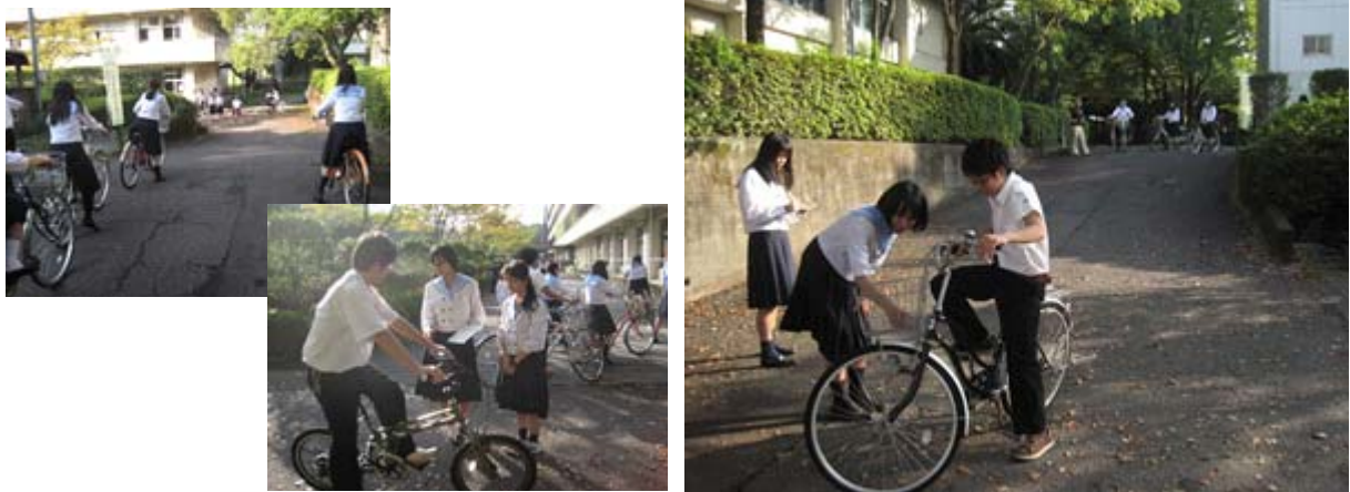
10月の「自転車検査」の様子

生徒自身が行う安全走行のための点検活動であり、安全安心な学校生活の醸成に自らが協力しているという自主的な態度を育成することにつながる