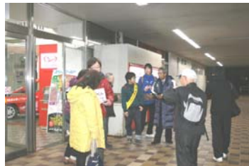
中津駅南口にて配布