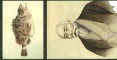
【左上】カサゴ写生図(個人所蔵)