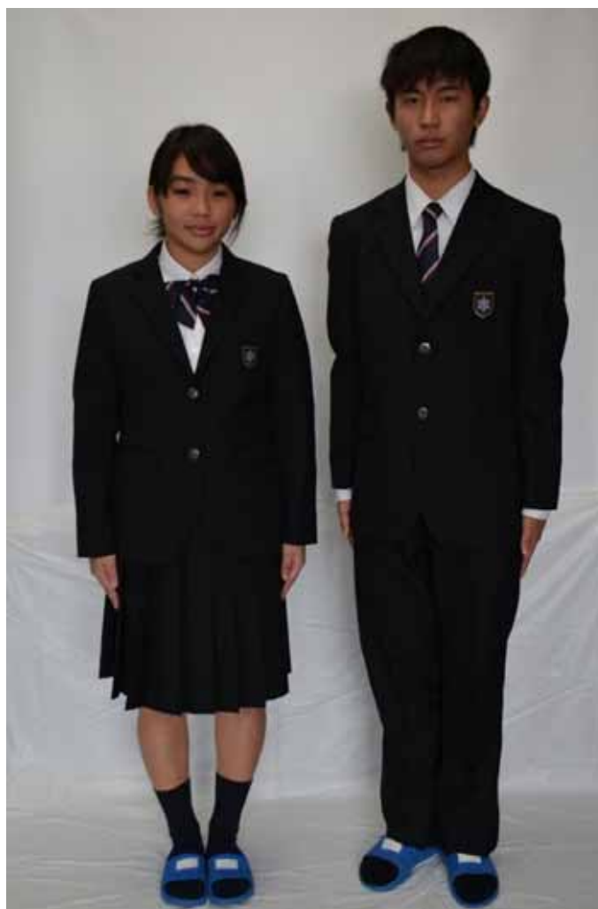
新たなデザインのブレザー