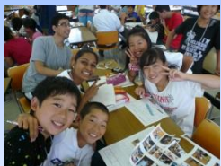
キャンプでの交流風景

2点目は、日本人・大分県人としてのアイデンティティの涵養です。今後、県民の皆様からのご意見を賜り、子どもたちに伝えたい大分の「よさ」「人」「もの」等を教材化し、道徳や音楽、美術の時間で「ふるさと教育」として展開してまいります。県教育委員会のホームページ上 ( http://kyouiku.oita-ed.jp ) で募集いたしておりますので、是非、海外でご活躍中の皆様方からも、ご意見をいただければ幸に存じます。