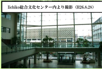
liehiko総合文化センター内より撮影 (H26.8.28)