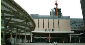
上野の森口（南口）を撮影 (H26.8.28)