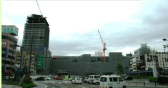
府内中央口（北口）を撮影 (H26.8.28)