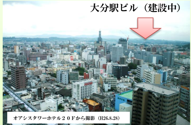
オアシスタワーホテル20Fから撮影 (H26.8.28)