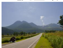
(九重町) 「やまなみハイウェイ」