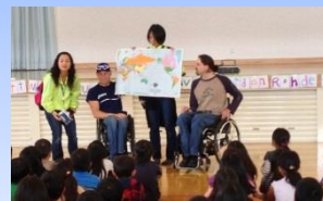
車椅子マラソン選手との交流