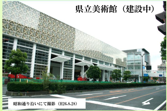
昭通り沿いにて撮影 (H26.8.28)