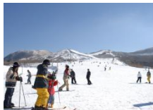
(九重町) 「九重森林公園スキー場」