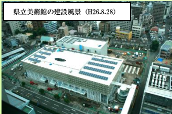
県立美術館の建設風景 (H26.8.28)