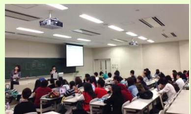
(APUでの打ち合わせの様子)