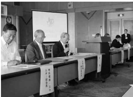
ごみゼロおおいた作戦県民会議

恵み豊かで美しく快適なおおいた』の実現を目指している。平成19年9月には、「大分県新環境基本計画」の基本目標に合わせ、「ごみゼロおおいた作戦県民会議」に設置する専門部会8部会を5部会に統合した。また、平成24年3月には、「大分県新環境基本計画」の改訂を行い、基本目標の「環境産業の育成」を「環境・エネルギー産業の育成」に、「すべての主体が参加する地域社会の形成」を「すべての主体が参加する美しく快適な県作り」に変更した。（ごみゼロおおいた作戦の概念図は次の図2-1を参照）