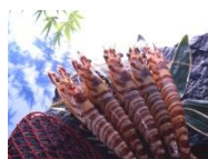
(姫島村) 島の特産 「姫島車えび」