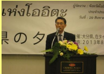
「大分県のタベ」での小風副知事あいさつ