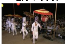
(姫島村) ユーモラスなキツネ踊り 「姫島盆踊り」