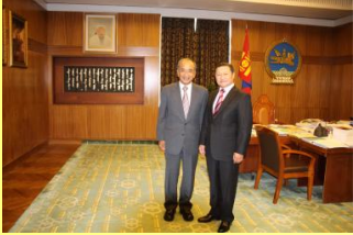
モンゴル国首相表敬

アルタンホヤグ首相からは、「人・技術・ものなど様々な交流を進めたい」とのお話があり、今後の交流促進が期待されます。