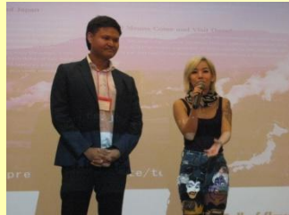
APU卒業生(タイ校友会会長、有名歌手)による大分県の観光PR