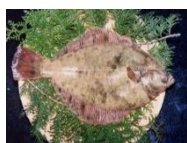
(日出町) 将軍に献上された天下の美味 「城下かれい」