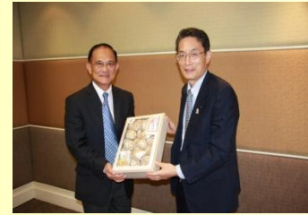
タイ国政府観光庁のスラボン総裁を表敬訪問