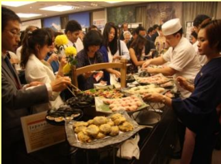
大人気の大分メニュー試食コーナー