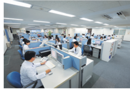
メディカルコールセンター (上野)