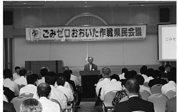
ごみゼロおおいた作戦県民会議

ごみゼロおおいた作戦は、平成17年10月に策定した大分県長期総合計画「安心・活力・発展プラン2005ーともに築こう大分の未来ー」において、分野横断的に集中的・重点的に取り組む8つの重点戦略の一つである「豊かな天然自然 磨き輝き