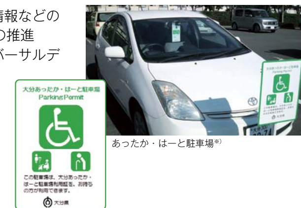
あつたか・はーと駐車場※