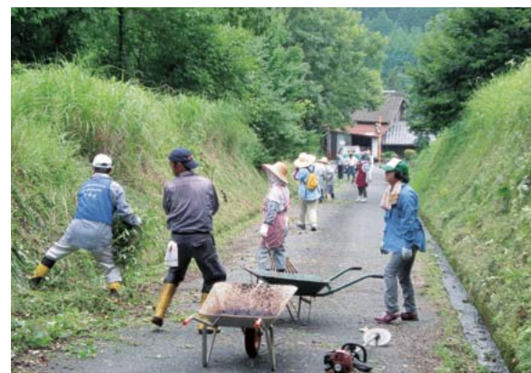
小規模集落応援隊による草刈り活動（国東市国東町）