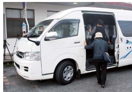
コミュニティバス（白杵市）