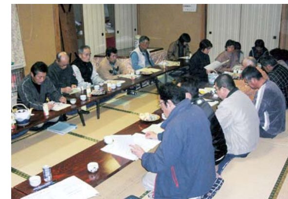
住民と県・市町村職員の話し合い（日田市中津江村）