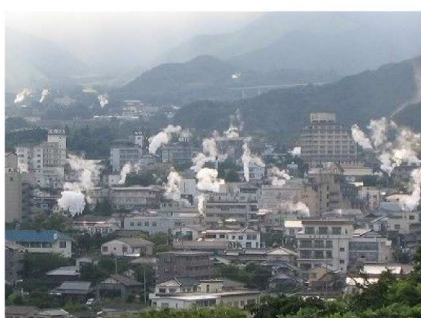
立ちのぼる湯けむり