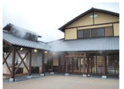
落ち着いた色合いの地獄蒸し工房