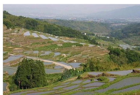
田園自然景観地域に広がる棚田