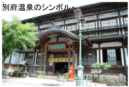
別府温泉のシンボル