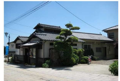
鉄輪温泉地区・まちなみ景観形成