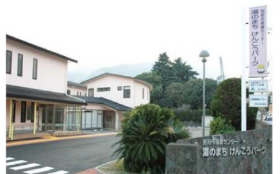
緑に囲まれた 湯のまち けんこうパーク