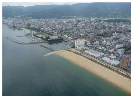
山と海 恵まれた自然環境