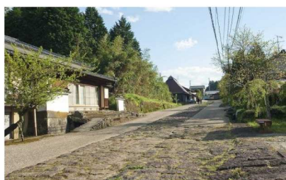
大分市大字今市「石畳」