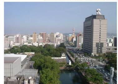
大分城址公園周辺地区

本計画のなかで、具体の景観整備の取り組みが早急に望まれる地域をリーディングプロジェクトとして位置づけています。その中で、大分城址公園周辺地区については、良好な景観の形成を図るために平成20年7月に都市計画法における「景観地区」および「地区計画」の決定を行っています。