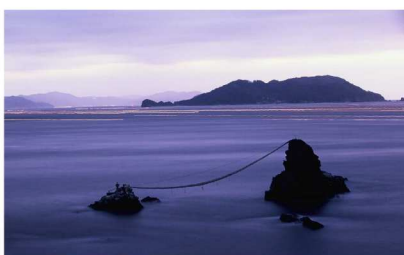
大分市大字佐賀関「豊後水道」