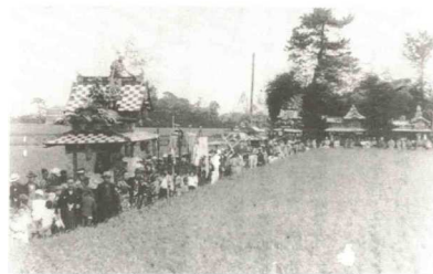
(ふるさと三佐)三佐公民館より

野坂神社の氏子により、三佐北、南地区において二日間にわたって行われる祭礼。江戸時代中期ごろより始まり、現在では宵宮では6基の人形を載いた山車、4基の太鼓山が年替わりに北もしくは南地区を練り進み、本祭りでは前途の山車に加え1基の神輿が、三佐北地区内の決められた道を午後から夜更けにかけてゆっくり練り進む雅なまつりです。主に地元で生まれ育った人々により運営されています。