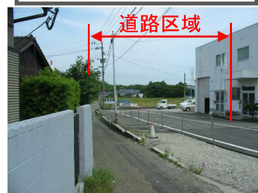
工事予定箇所(参考)

事業の完了後には、地区内道路体系が整備され、道路網計画と整合する計画的土地利用の誘導(農・住・工混在状況の解消、新たな都市機能の導入等)と、沿道部を軸とした街並み景観の形成、住環境の改善(防災性の強化等)に向けた、老朽化住宅の建替え促進が予想されます。