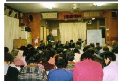
三佐北地区説明会

各区自治会を母体として、三佐北地区(三佐三区、四区)における住環境整備の促進を目的に、街づくりの具体案の作成や行政との協議、地区住民の話し合いなど、行政と住民の間であって、よりよい街づくりに向けた活動を展開しています。