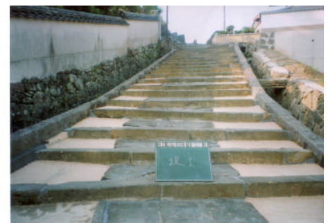
観光交流センター整備後