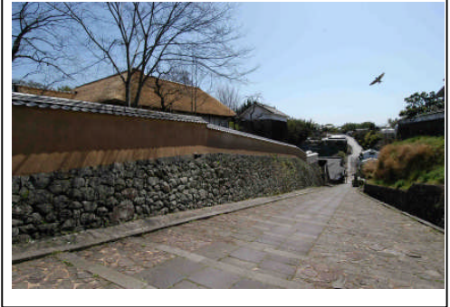
飴屋の坂整備前後