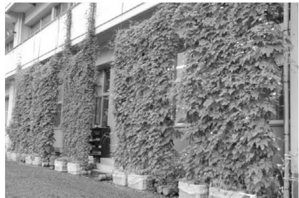
緑のカーテンフォトコンテスト・最優秀賞 （豊後大野市立大野小学校）