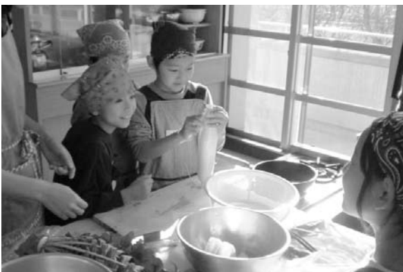
秋「エコ食ライフ」～エコ・クッキング（国東市）