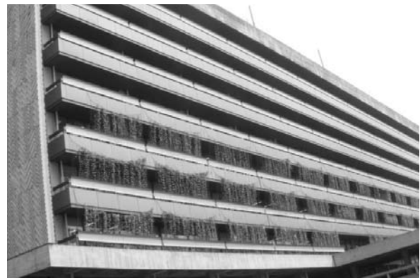
緑のカーテン（県庁舎）

また、「緑のカーテンフォトコンテスト」を今年度初めて実施し、家庭、学校、事業者から147件の応募があり、最優秀賞1点、部門賞3点、特別賞5点を表彰した。