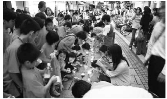
「キャンドルナイトin府内五番街」(大分市)

大分市では、廃油キャンドルの回廊がつけられた「キャンドルナイトチャレンジin府内五番街」が、豊後大野市では竹灯籠の灯りと大正琴の調べの中で「三重川キャンドルナイト」が実施されるなど、県下各地で特色ある取組が展開された。