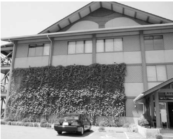
春「エコ花ライフ」～緑のカーテン（大分市）

春にはアサガオやヘチマ等のツル性植物で窓際や壁面に「緑のカーテン」を育てる『エコ「花」ライフ』、夏には風呂の残り湯などの二次利用水を使って「打ち水」を行う『エコ「涼」ライフ』、秋には食材の使い切りや省エネ調理法などの「エコ・クッキング」に取り組む『エコ「食」ライフ』、冬には重ね着等により暖房の設定温度を抑制する『エコ「暖」ライフ』の実践を呼びかけている。