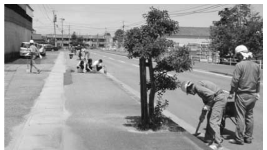
120万人県民一斉ごみゼロ大行動(中津市)

平成21年度は環境美化の日を8月2日に設定し、美化活動の実施を呼びかけたところ県下で約11万人の県民が参加し、約160トンものごみが収集された。