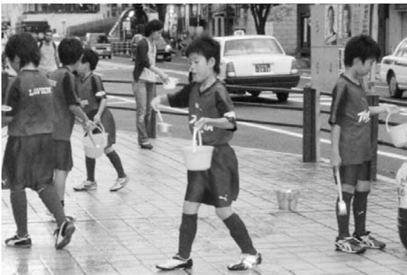
夏「エコ涼ライフ」～打ち水