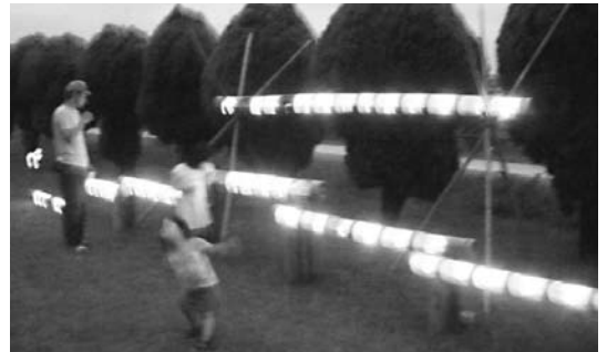
「三重川キャンドルナイト」(豊後大野市)