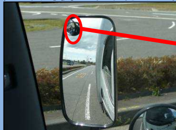
サイドミラーでは自動二輪車 を確認できない。