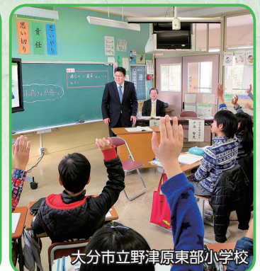
大分市立野津原東部小学校

そのような中で県議会としては、県民の皆様の声に真摯に耳を傾け、様々な発想や自由なご意見・考えを伺い、各選挙区から選出された議員が執行機関と真摯な議論を重ねながら、激動の時代に何が具体的に出来るのかということを決めていくことで、大分県の進むべき新たな道が開けると考えております。また、その道の先には、世界中で大分県があつてよかったと言われるようなになればと思っております。 今後とも、議長の補佐役として、公正・円滑な議会運営はもとより、県議会の活性化さらには大分県の発展のために、誠心誠意努力してまいりますので、皆様の御理解と御協力を心からお願い申し上げます。