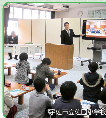
宇佐市立佐田小学校