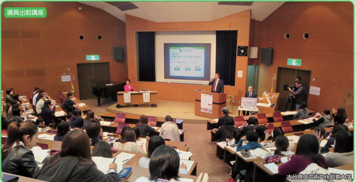
大分県立芸術文化短期大学