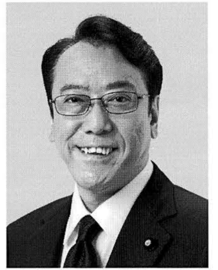
ながさわ 長沢 ひろあき 現 参院災害対策特別委員長。 参院議員1期。東洋大学卒。57歳。 庶民とともに行く。