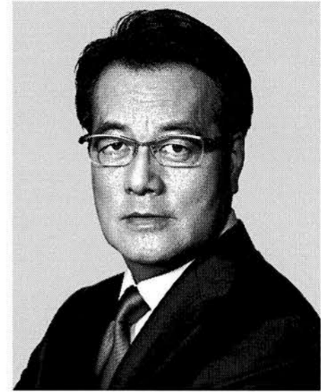
民進党代表 岡田 克也