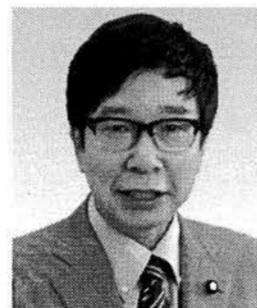
参院議員 大門みきし 現 1956年、京都市生まれ。神戸大学中退。参院3期。党参院国対副委員長。 【活動地域】京都以外の近畿