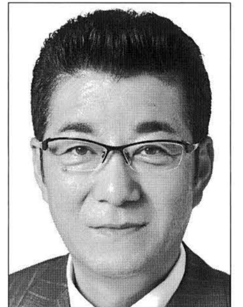
代表 松井 一郎