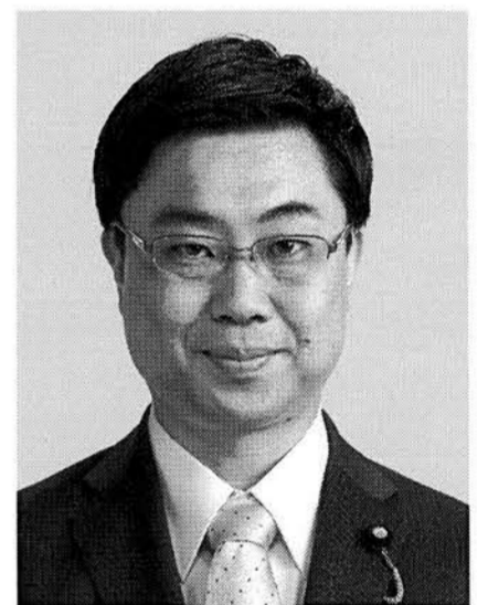
こうぞう あきの 公造 現 党参院政策審議副会長。参院議員1期。 長崎大学大学院修了。48歳。 明日の『健康ニッポン』を造る。

公明党は、参院選比例区に上記の6人をはじめ17人を公認しています。(順不同) ※年齢は公示日現在