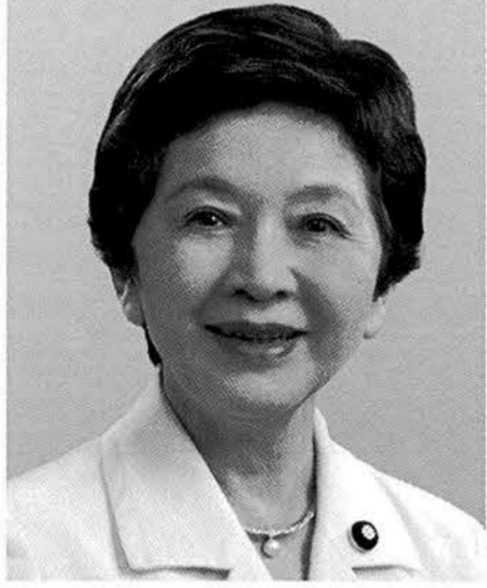
日本のこころ代表 中山恭子 元拉致問題担当大臣