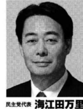
民主党代表 海江田万里