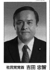
社民党党首 吉田 忠智