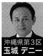
沖縄県第3区 玉城 デニー